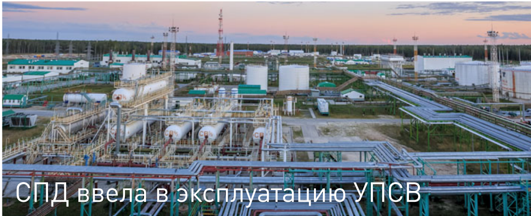
СПД ввела в эксплуатацию УПСВ

СПД регулярно входит в число лидеров рейтинга концерна «Шелл» по направлению WRFM. В частности, по итогам 3-го квартала 2017 года компания заняла 2-ю строчку. По итогам 2016 года СПД заняла 1-е место в рейтинге концерна «Шелл» по качеству данных Global Data Quality Dashboard по направлению WRFM.