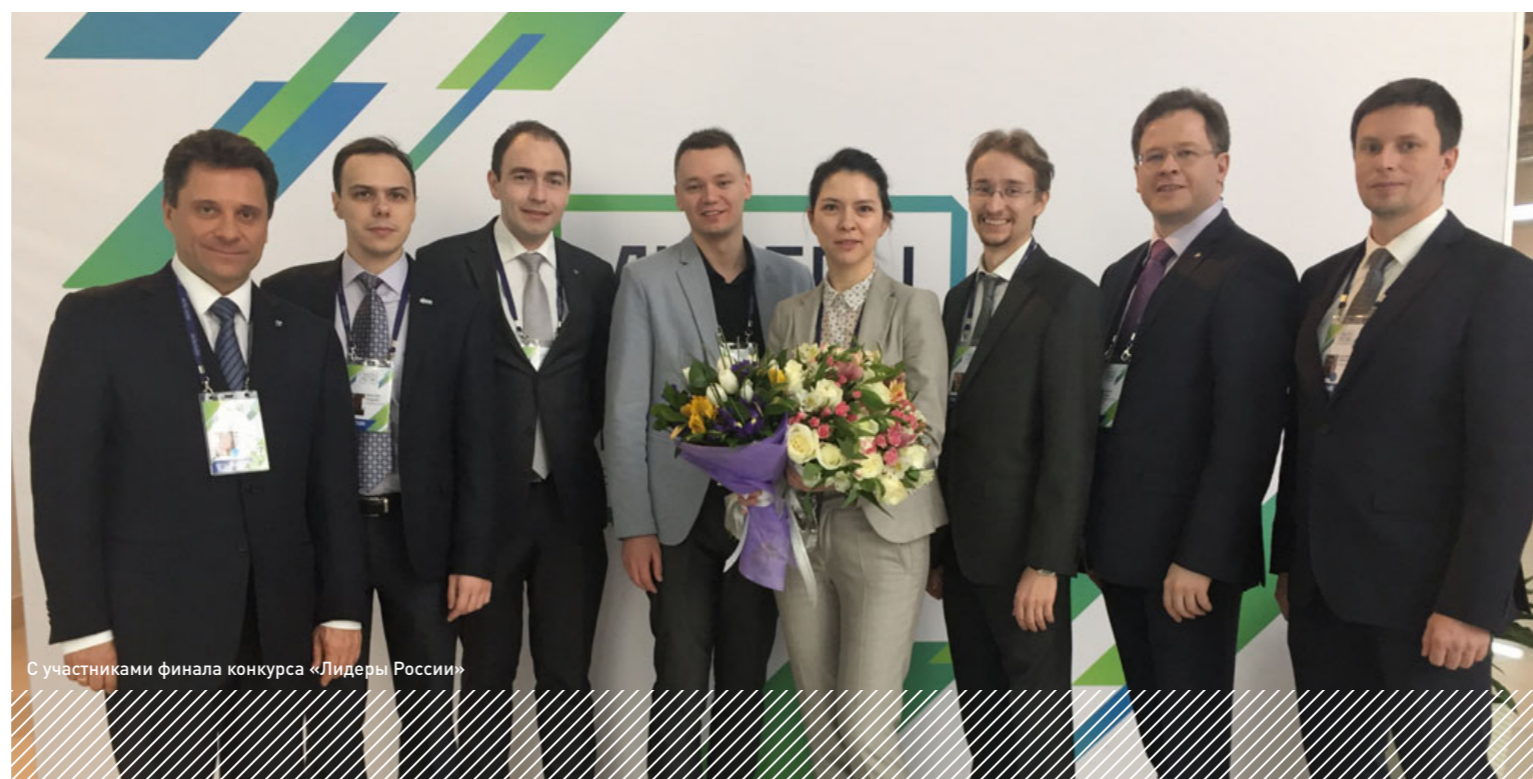
С участниками финала конкурса «Лидеры России»

— Благодаря участию и выходу в финал в проекте «Лидеры России» я получил грант и осенью буду поступать на Executive MBA*. Уже некоторое время назад я начал