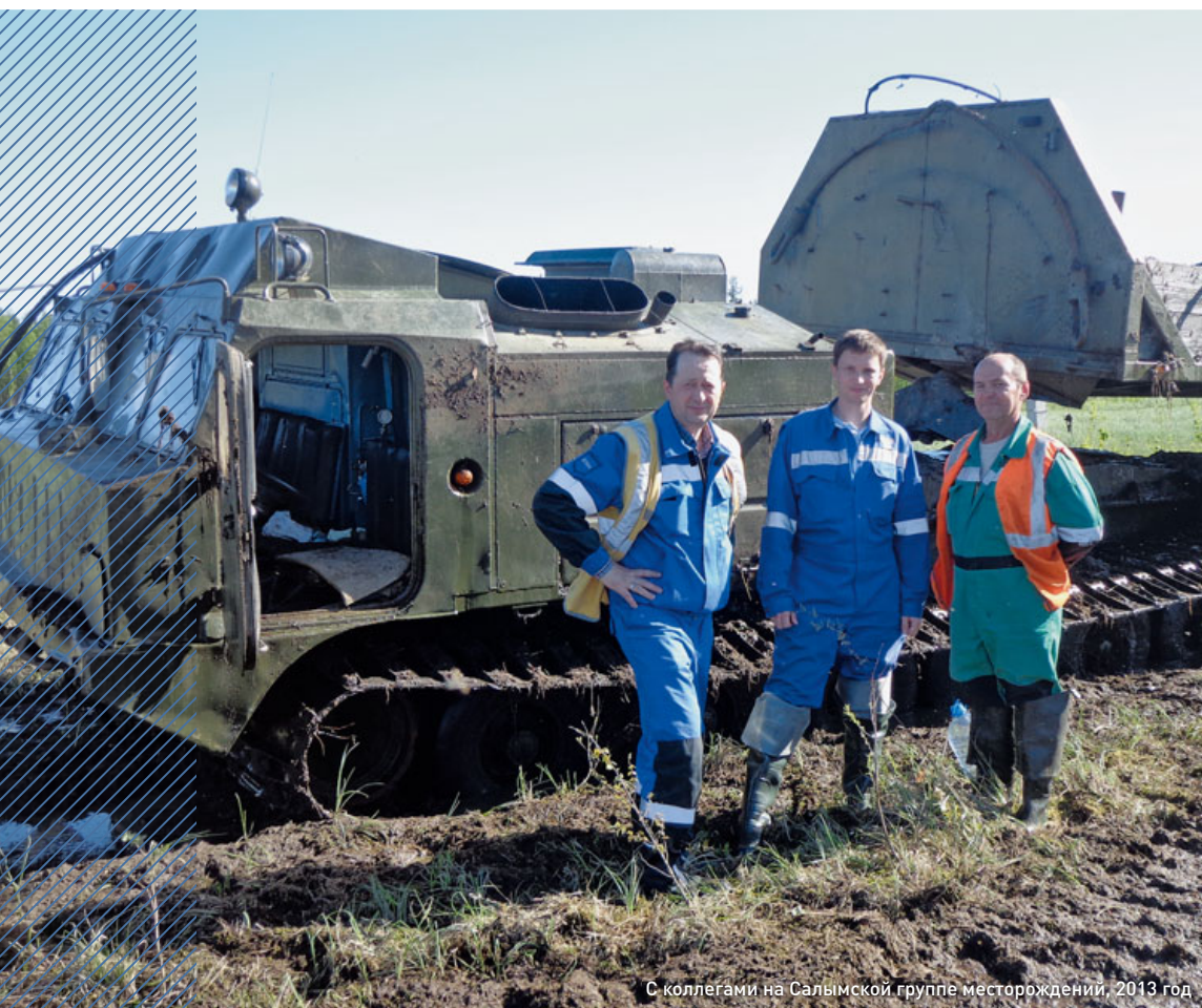
С коллегами на Салымской группе месторождений, 2013 год

— В 2006 году я поступил на юридический факультет Нижегородского государственного университета. Мне было очень интересно учиться по новой специальности, изучать применение правовых норм в тех рабочих ситуациях, с которыми я сталкивался на практике, а также изучать психологию. Будучи на свободной вахте, я прошел стажировку в юриди-