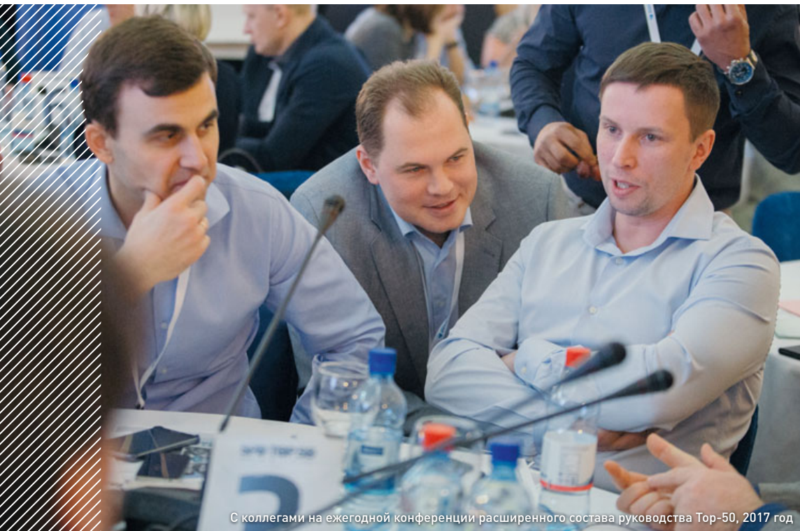
С коллегами на ежегодной конференции расширенного состава руководства Топ-50, 2017 год

у нас, в СПД, есть система регулярных профилактических осмотров. Врач, осматривавший меня годом ранее, обратил внимание на изменения в показателях анализов и направил меня на дальнейшее обследование, в результате которого был поставлен такой диагноз. Для проведения осмотров персонала на Салымскую группу месторождений приезжают квалифицированные медики, что еще более важно, к нам приезжают одни и те же люди. Именно благодаря тому что этот врач наблюдает меня регулярно, он смог оценить эти отклонения показателей как критичные. После магнитно-резонансной томографии, которая показала метастазы, я прочитал очень много информации в интернете, началась паника. Дობ-