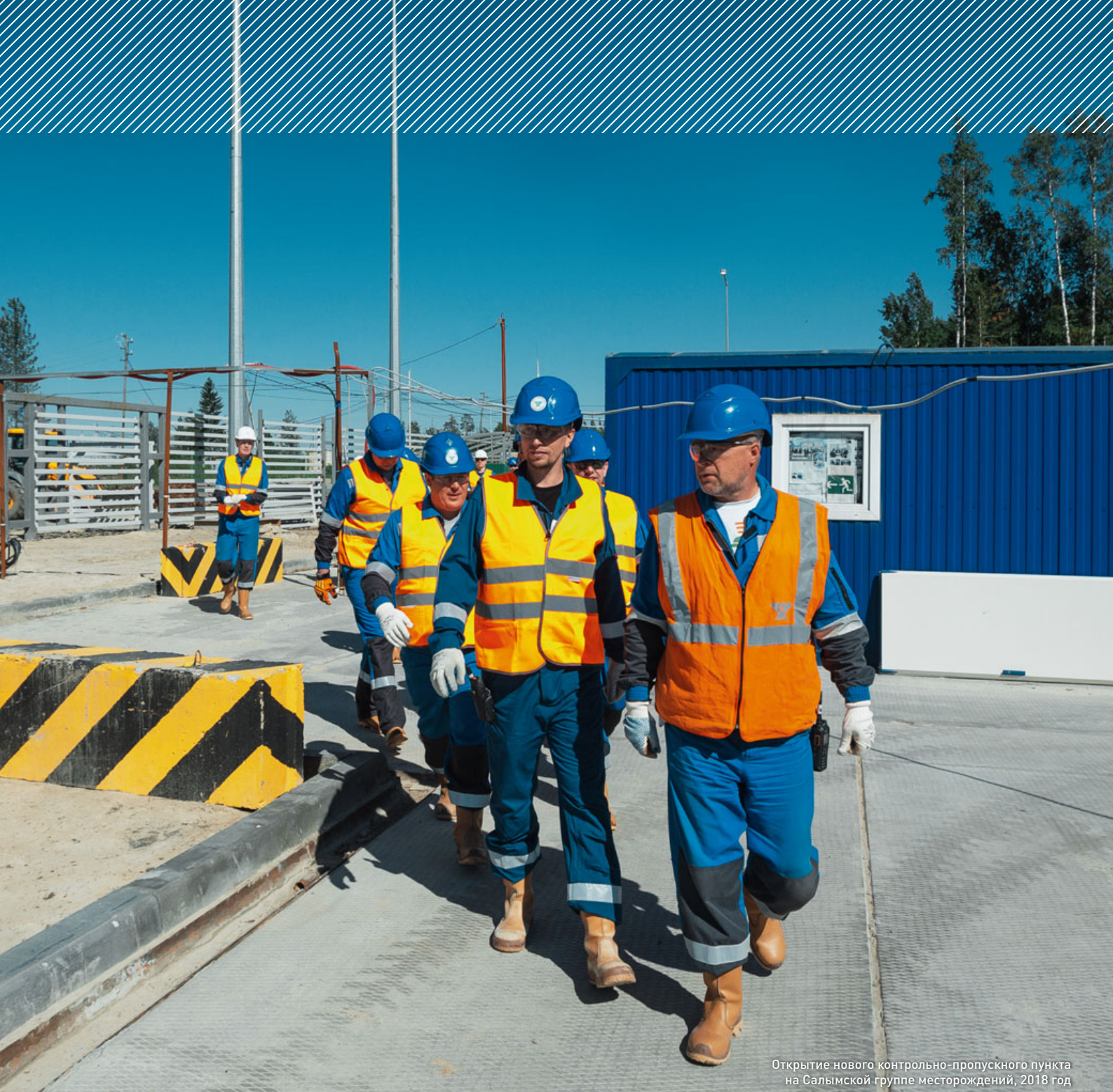
Открытие нового контрольно-пропускного пункта на Салымской группе месторождений, 2018 год