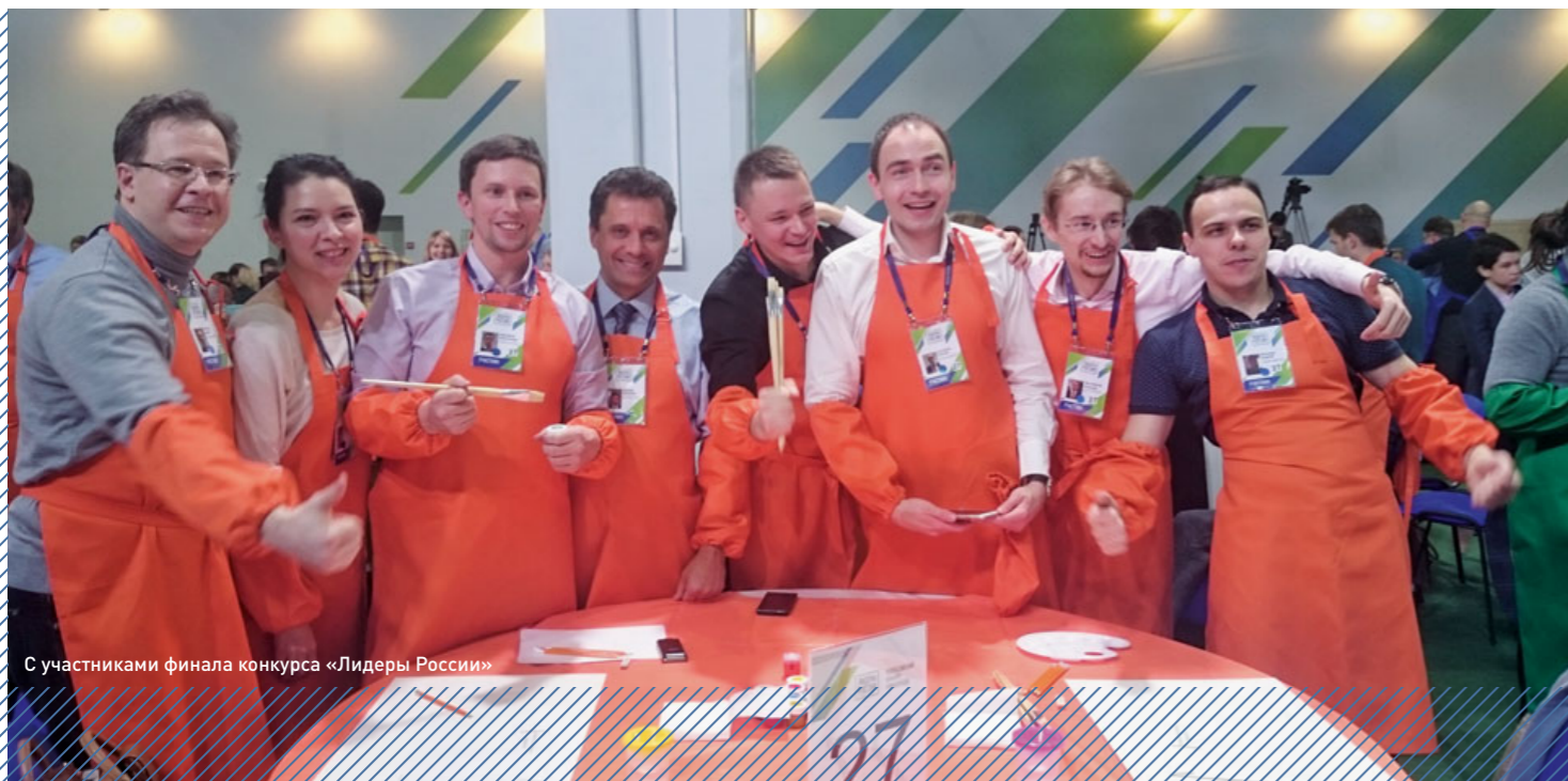
С участниками финала конкурса «Лидеры России»

со сменщиком основные обязанности входят: безопасность сотрудников отдела и место-рождений в целом, управление коллективом отдела, контрактами, бюджетом. Это большая и интересная работа, которая постоянно ставит перед нами новые задачи.